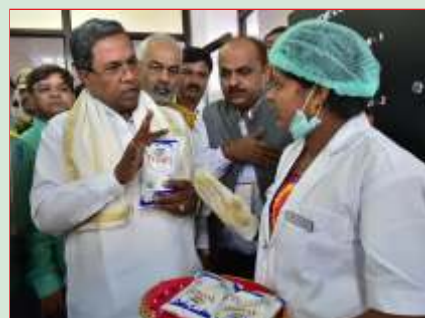
ನಂದಿನಿ ಫ್ಲೆಕ್ಸಿ ಪ್ಯಾಕ್ ಹಾಲಿನ ಬಗ್ಗೆ ಮಾಹಿತಿ ಪಡೆಯುತ್ತಿರುವ ಸನ್ಮಾನ್ಯ ಶ್ರೀ ಸಿದ್ದರಾಮಯ್ಯನವರು.

ಫ್ಲೆಕ್ಸಿ ಸಂಸ್ಕರಿಸಿದ ಹಾಲಿಗೆ ಶೀತಲೀಕರಣ ವ್ಯವಸ್ಥೆಯ ಅವಶ್ಯಕತೆ ಇಲ್ಲದ್ದರಿಂದ ಸುದೀರ್ಘ ಬಾಳಿಕೆ ಅವಧಿ ಇರುವುದರಿಂದ, ನಿರ್ವಹಣಾ ವೆಚ್ಚದಲ್ಲಿ ಕಡಿತವಾಗಿ, ಲಾಭಾಂಶದಲ್ಲಿ ಹೆಚ್ಚಳವಾಗಿ, ಹೆಚ್ಚಿಚ್ಚು ಪ್ರಮಾಣದಲ್ಲಿ ಹಾಲು ಮಾರಾಟ ಮಾಡಲು ಮಾರಾಟಗಾರರು ಉತ್ಸುಕರಾಗುತ್ತಾರೆ.